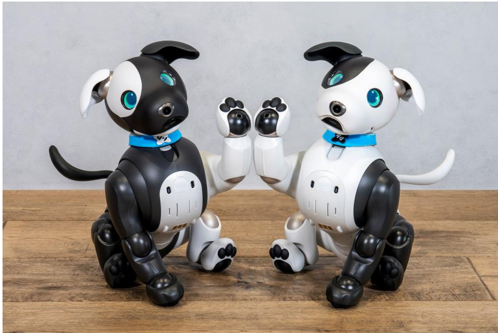
(左:シンジル エディション 右:タクセル エディション)

aibo は人とつながりを持ち、育てる喜びや愛情の対象となることを目指して開発されたロボットです。自ら好奇心を持ち、人と寄り添いながら毎日を共に楽しく生活し、共に成長していくパートナーとなることを目指しています。