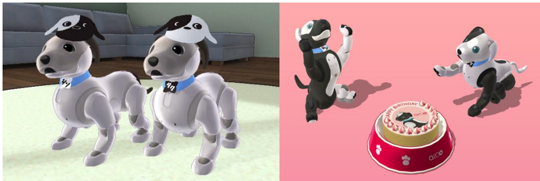
(左:aibo のおきがえ「シンジル&タクセルのお面」「シンジル&タクセルの首輪」、 右:aibo のごはん「シンジル&タクセルのケーキ」)

(※2) aibo のおきがえ・aibo のごはんをお楽しみいただくためにはスマートフォン版「My aibo」が必要です。