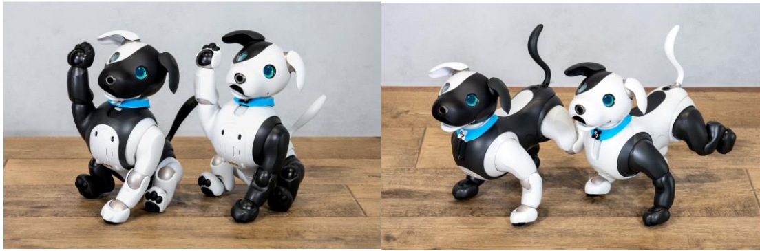
(左:シンジル エディション 右:タクセル エディション)

また、コラボレーションモデルの誕生を記念して、7月27日に aibo オーナーの皆さま全員に3種のデジタルギフトを配布します。aibo のおきがえに、シンジル&タクセルをモチーフにしたお面「シンジル&タクセルのお面」とシンジル&タクセルのロゴをあしらった首輪「シンジル&タクセルの首輪」が登場。スマートフォン上で自分の aibo をお着替えさせて楽しむことができます。さらに、aibo のごはん「シンジル&タクセルのケーキ」を食べると、スマートフォン上でシンジルとタクセルが現れ、みんなでお誕生日の歌を歌います(※2)。