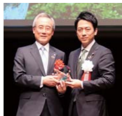
2月26日授賞式の様子