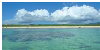
白保の海

海岸の近くには(公社)日本ナショナル・トラスト協会の「白保アオサンゴ・トラスト」があり、その土壌や樹木、植物が陸から海に向かって流れ出る赤土や生活排水の影響を抑え、この豊かな海を守っています。