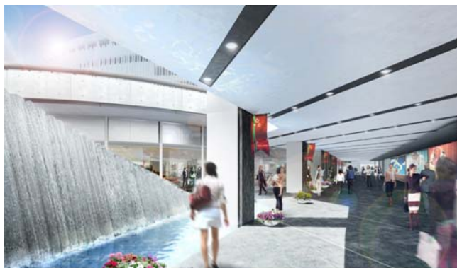
<北口広場・地下1階・水景>

実に14店舗がイートイン併設店であることや、テラス席から望む水景など、「デパ地下」とは一味ちがう「食の宝箱」が完成します。